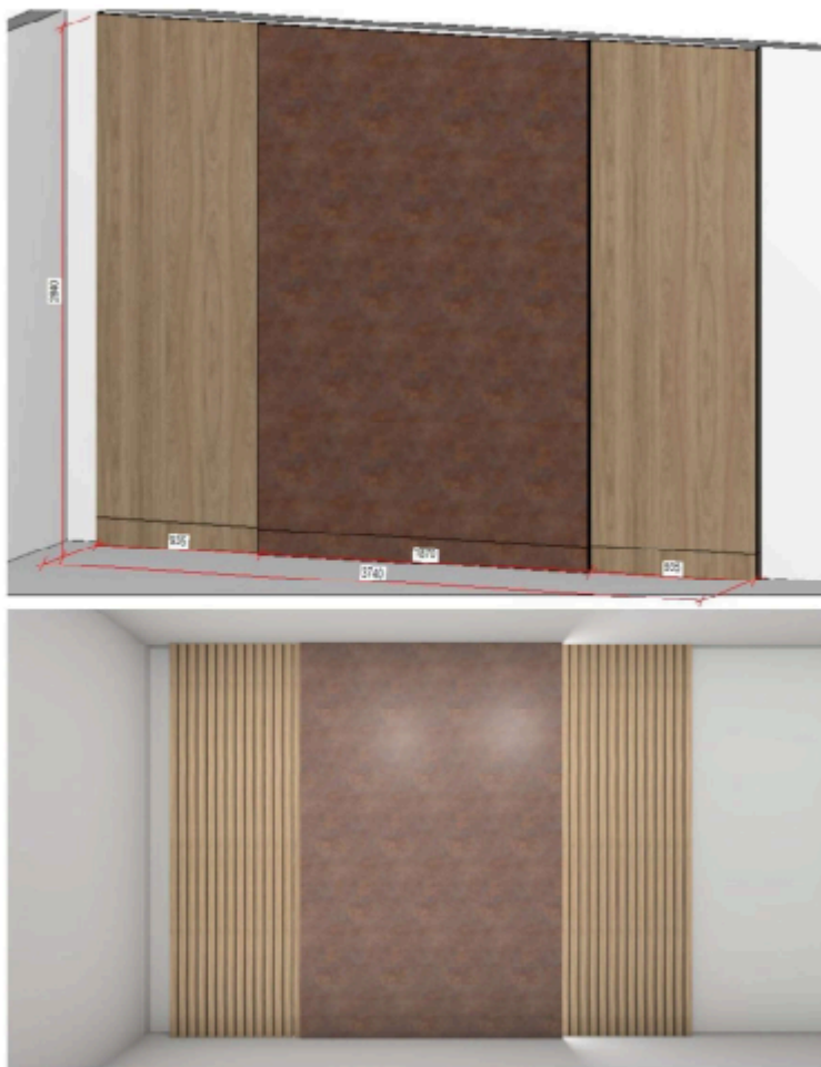
*Painel ripado Presidente